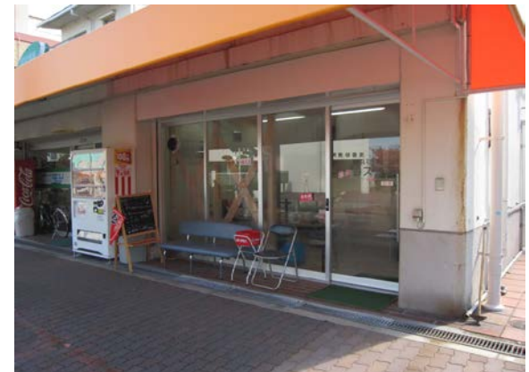
コミュニティカフェ「コスモス」