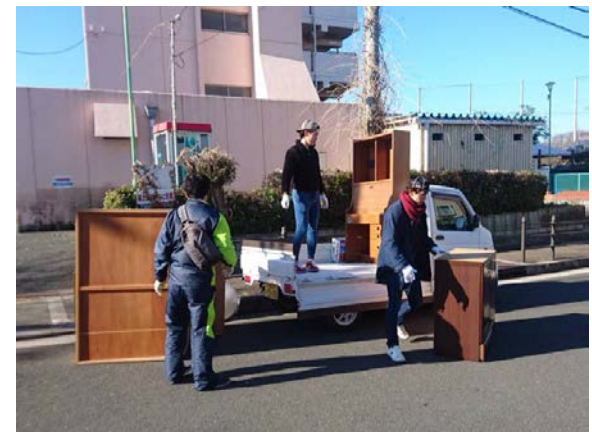
年末の大掃除のお助けイベント「MONO捨て隊」